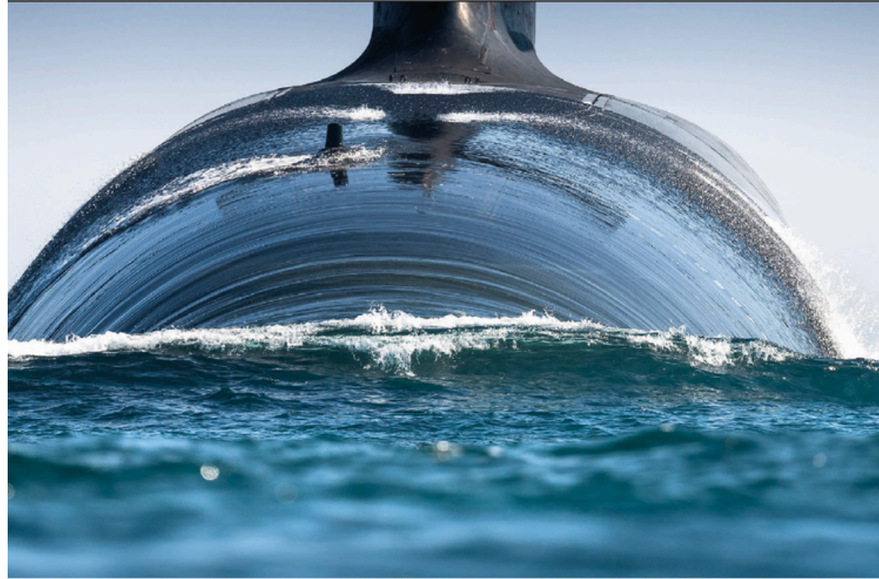
Le Terrible , un des quatre sous-marins lanceurs d'engins de la Marine nationale, s'apprête à se « diluer » dans les eaux de la mer Celtique. Élément clé de la force de dissuasion nucléaire française, ce sous-marin transporte 16 missiles portant chacun plusieurs têtes nucléaires et navigue à travers le globe de façon totalement indétectable.