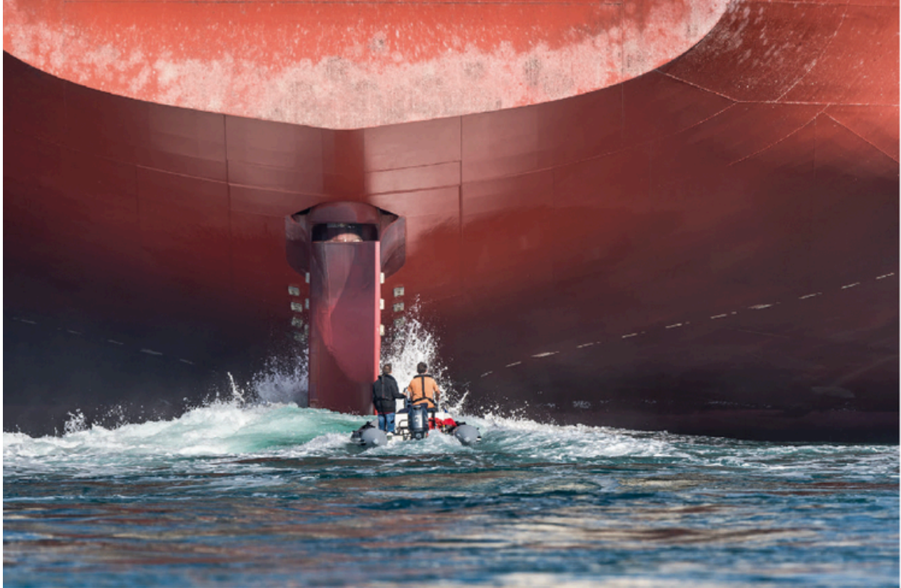
Un cargo Panamax, conçu pour pouvoir franchir le canal de Panama, navigue en direction de Brest, pour subir un entretien. Vidé de sa marchandise, le navire laisse apparaître son safran, visible à la surface.