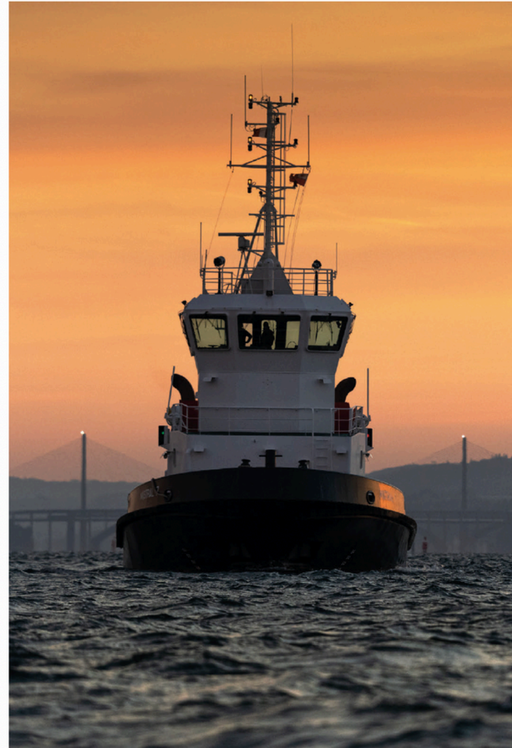
Un remorqueur portuaire, au petit matin, sur les eaux de la rade de Brest. Ce navire puissant a pour mission de remorquer de grands navires venus suivre un entretien ou rejoindre le port.