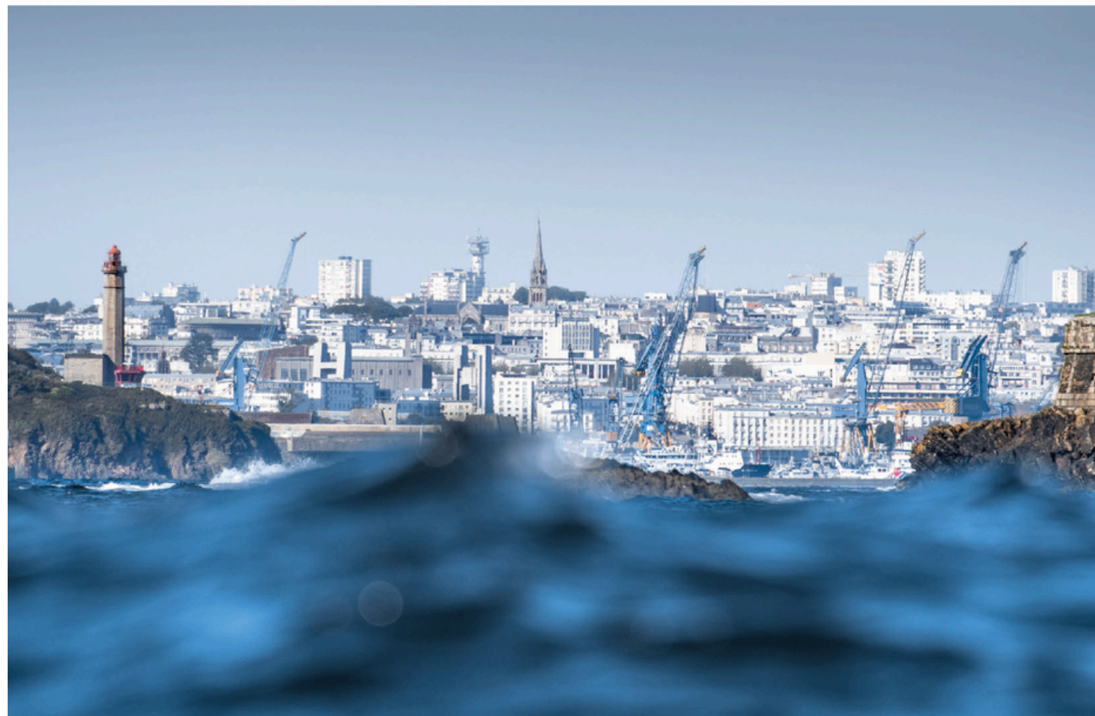
↓ Brest, capturée depuis le large. Un point de vue rare sur la ville, qui se déploie sur toute sa largeur, entourée par Camaret, sur la droite, et le phare du Porzic, à gauche.