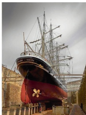
Belem et radoub, 33 x 47cm, tirage en 12 exemplaires

Choses maritimes , d'Ewan Lebourdais, aux Éditions Odyssée, 2023. Carènes, acte II, 2022.