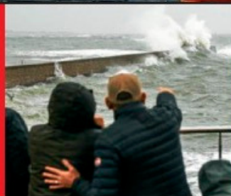
P. Roussel

« Chasseurs de tempête » Comment faire des photos et des vidéos en sécurité Ewan Lebourdais et Mathieu Rivrin, photographes chevronnés, nous délivrent quelques astuces. P.12