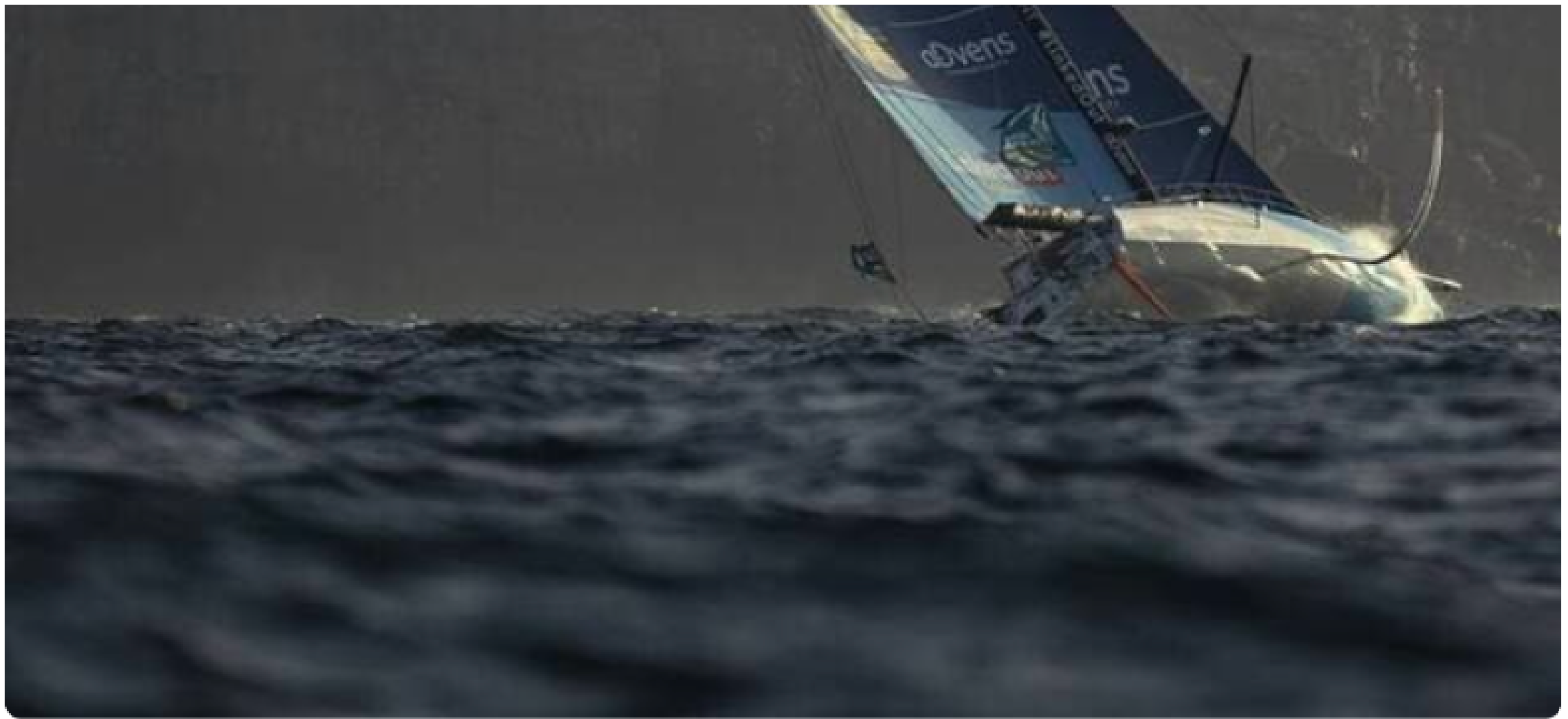
Salutation au cap Fréhel !

Le résultat est à l'image de ce que l'on connaît d'Ewan Lebourdais : des clichés pris sur le vif, nets, saisissant la puissance incroyable des voiliers lancés pleine balle dans cette transat. Mention spéciale pour les photos prises à la tombée du jour, lorsque les bateaux enveloppés d'une lumière dorée saluent le cap Fréhel avant la grande traversée.