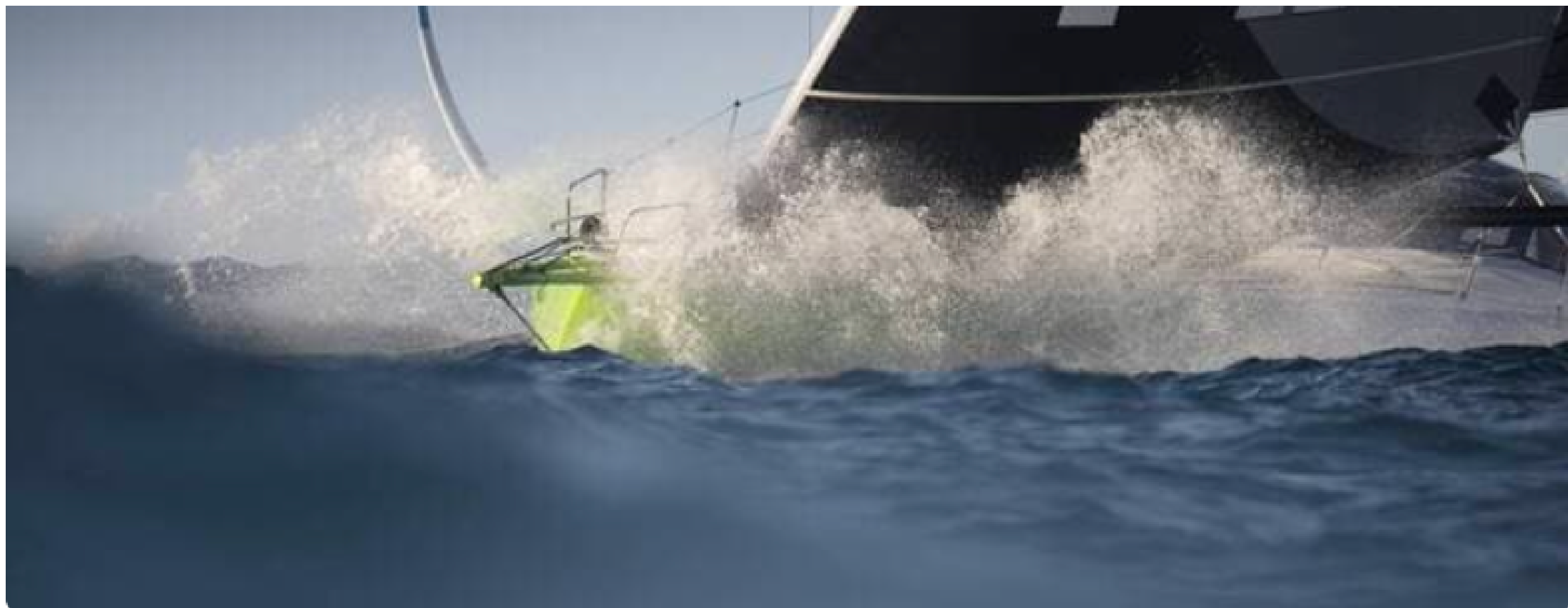
Le départ de la Route du Rhum a été donné le 9 novembre 2022, à Saint-Malo